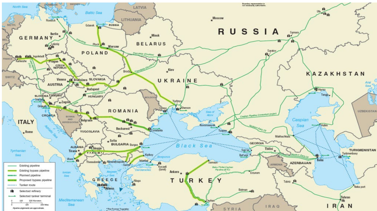
شکل ۱. خط لوله دروژبا

شارل میشل، رئیس شورای اروپا با انتشار توییتی ضمن اعلام توافق سران اتحادیه برای ممنوعیت واردات حداکثری نفت از روسیه تا پایان سال جاری میلادی تاکید کرد که این ممنوعیت بیش از دو سوم واردات نفتی از روسیه را در بر می‌گیرد که تا پایان سال جاری میلادی این محدودیت باید به ۹۰ درصد برسد، موضوعی که سبب خواهد شد بخش بزرگی از منبع تامین مالی مسکو در تنش با اوکراین قطع شود. اتخاذ این تصمیم پس از جلب رضایت دولت اوربان، رییس‌جمهور مجارستان مبنی بر اعمال برخی از معافیت‌ها در واردات نفت این کشور از روسیه صورت گرفت. به گزارش فرانس پرس، به‌رغم اعمال ممنوعیت تازه برای واردات نفت روسیه، این ممنوعیت در گام نخست واردات از طریق خط لوله دروژبا را که محل اصلی تامین نفت برای مجارستان به شمار می‌رود، شامل نخواهد شد. خط لوله دوستی ۲ (دروژبا) بزرگترین خط لوله انتقال نفت خام جهان، به طول ۴۰۰۰ کیلومتر می‌باشد، که از روسیه آغاز شده و پس از گذر از کشورهای اوکراین، بلاروس، لهستان، مجارستان، اسلواکی، جمهوری چک و آلمان، تمامی اروپای شرقی را پوشش می‌دهد. ظرفیت انتقال نفت خام خط لوله دروژبا به‌طور میانگین معادل ۱٫۲ میلیون بشکه در روز می‌باشد. اهمیت و پوشش این خط لوله در شکل ۱ نمایش داده شده است.